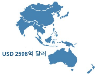
2019 아태지역* IoT 지출규모